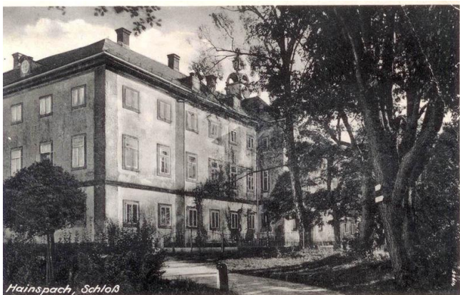
Původní podoba zámku ze začátku dvacátého století

Palace buildings are currently not accessible to the public. The structure stability is disturbed and the roof is missing completely. Degradation of the building which started in 80s by the owner's lack of interest continued with the fire in 2006 now continues because of the weather influences. The salvation on the chateau Lipová near Šluknov, especially its north wing, lies in the complete reconstruction. This includes static securing of walls, restoration of arches, new roof, interior and exterior plastering including windows and doors and restoration of staircases. The renovation also includes the restoration of the flooring and ceilings so that the chateau can be used by public after reconstruction. The main goal of the project is the reconstruction of the north wing and its opening to the public. Together with the project partners, we will open an exhibitions in the chateau. The project will also include one-off cultural activities (concerts, exhibitions, workshops). Target groups are inhabitants of the region, tourists, but also participants of the seminars, workshops, concerts and exhibitions both from Czech Republic and abroad, especially from neighboring Saxony. The project partners bring a very